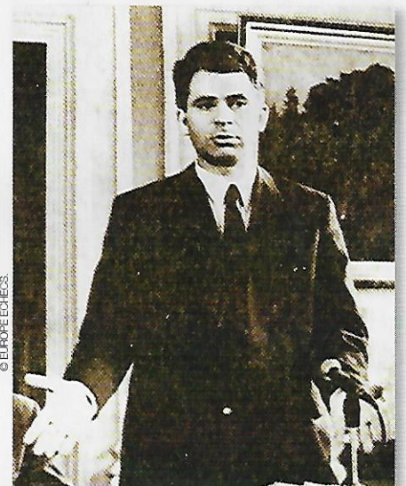
Spassky en conférence de presse.

Le 26 e match de l'histoire du championnat du monde avait débuté, ce 14 avril 1969, devant plus de 2000 spectateurs et c'est Petrossian qui ouvrit le score dès la 1 re partie avec les Noirs en jouant une Sicilienne. La surprise préparée par Spassky fut un usage répété de la défense Tarrasch avec les Noirs, dont la correction était jugée suspecte. Depuis le match Lasker-Tarrasch en 1908, elle n'avait plus été utilisée dans un match pour le titre mondial. Spassky créa la surprise, dès la 2 e partie, quand il annula sans rencontrer de réel problème. La 4 e représente le moment critique de ce championnat, surtout sur le plan psychologique. Ce fut la première victoire de Spassky avec les Noirs, après avoir joué 39 parties contre Petrossian. ■