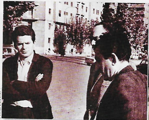
De g. à d. Spassky, O'Kelly et Petrossian.

Boleslavsky : Cela n'avait pas de sens de se débarrasser du pion isolé : 18...d4?! 19.♗xd4 ♗xd4 20.exd4 ♗xd4 21.♗b5 ♗xc1 22.♗xd4! et les simplifications étaient à l'avantage des Blancs. Accessoirement, on ne joue pas la défense Tarrasch pour ensuite s'angoïser à cause de la faiblesse du pion d5.