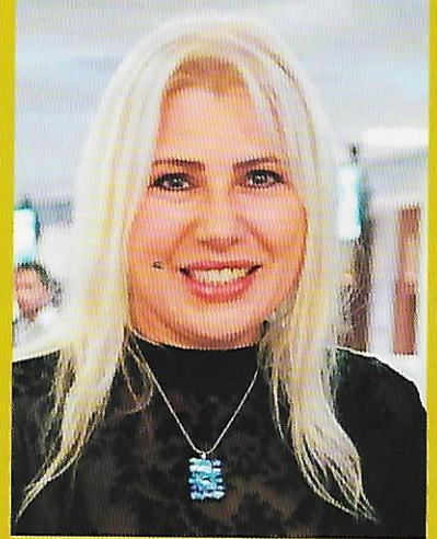
SUSAN POLGAR LA 8 e CHAMPIONNE DU MONDE À L'HONNEUR

BELGIQUE 8,07 €, SUISSE 11,50 FS, LUXEMBOURG 7,77 €, ESPAGNE 7,30 €, CANADA 8,95 $, MAPOC 65 MAD, TUNISIE 7,40 TND, GRÈCE 7,60 €, DOM 8 €, ITALIE 7,10 €, PORTUGAL 7,50 €.