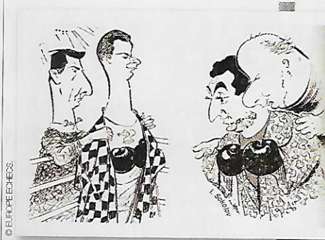
Caricature de Spassky et Petrossian, avec leurs secondsants.