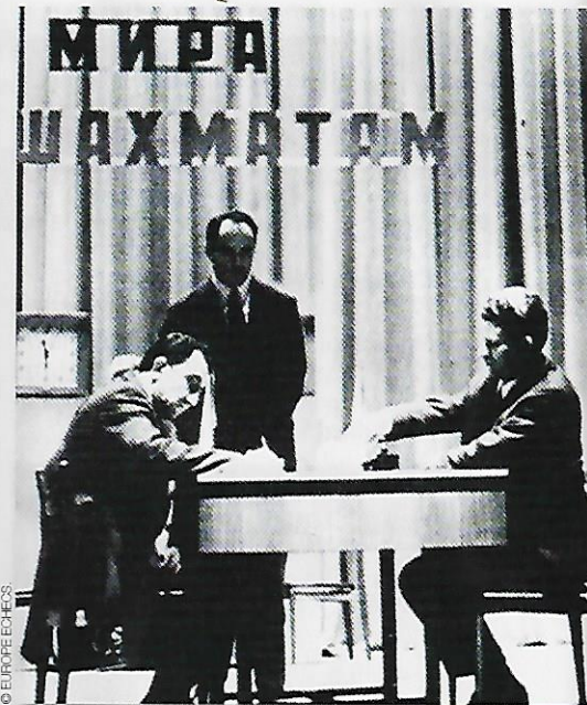
Scène du match à Moscou.