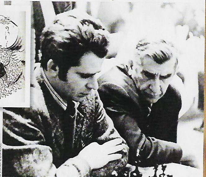
Spassky avec son secondant Igor Bondarevsky.

Une pointe tactique qui laisse le pion d4 sans défense.