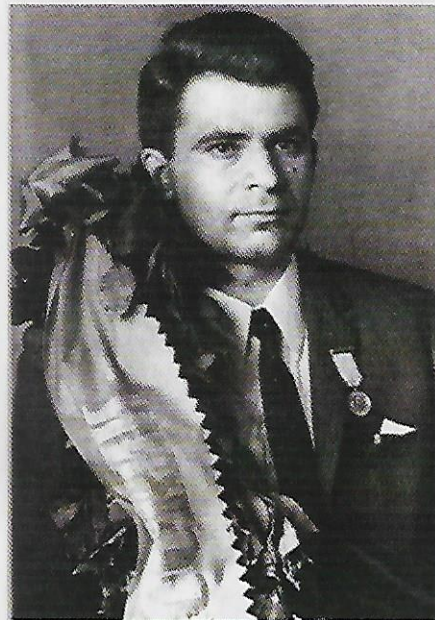
Spassky sacré en 1969.

Le match de 1969 avait beaucoup de points communs avec celui qui avait opposé les mêmes adversaires trois ans plus tôt, à Moscou, au « Théâtre des Variétés ». Etaient présents les mêmes arbitres, avec Albéric O'Kelly et Miroslav Filip, et les mêmes seconds, Isaak Boleslavsky pour Petrossian et Igor Bondarevsky pour Spassky. En 1966, le match débuta avec 6 nulles et il fallut attendre la 13 e pour